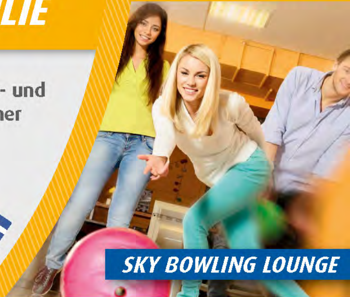
SKY BOWLING LOUNGE